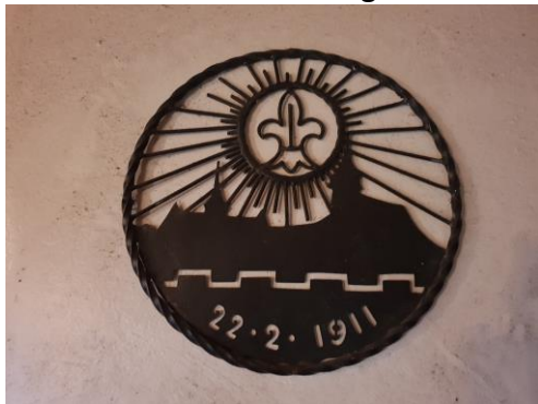
Emblem på peisen på Skauen.

Krakoseter er satt sammen av de gamle kretsnavnene KRistiania, AKershus og OSlo. Oslo krets var den første kretsen som ble opprettet i Norge. Kristiania krets regnet 22. februar 1911 som sin stiftelsesdag.